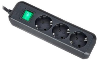
P1501 SchuKo 3er Verteiler