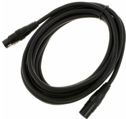
L0104 DMX 3-Pol 3m