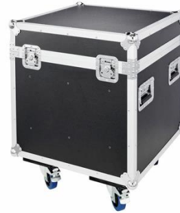
C2011 Multiflex Würfel

Kabelkiste mit 3 festen Unterteilungen Stückzahl: 3