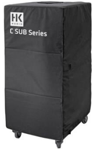
C9004 CSub Raincover