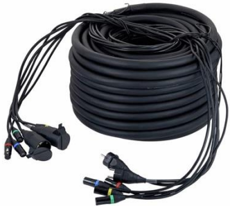
N2002 Multicore FoH 50m

Leitungen: 2x Ethercon, 2x DMX, 2x Schuko Stückzahl: 1