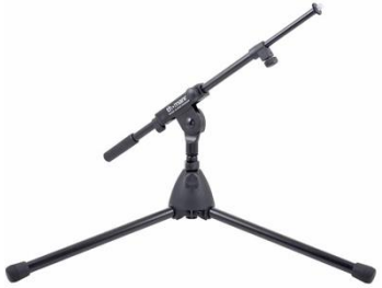
R5001 Mikrofonstativ klein