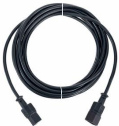
P3002 Kaltgeräte Verlängerung