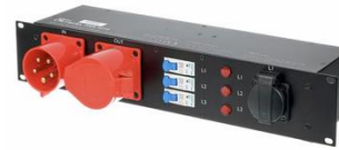
P0082 32A CEE Verteiler