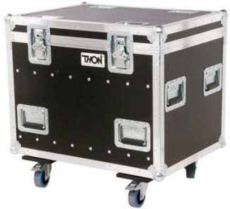
C3001 Beam 230 Case