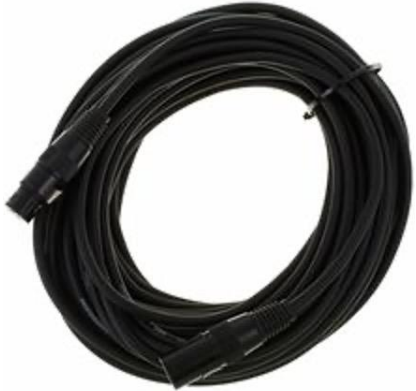
L0108 DMX 3-Pol 20m