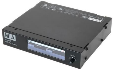
L0002 Grand MA 3 Node 2 Port 2k