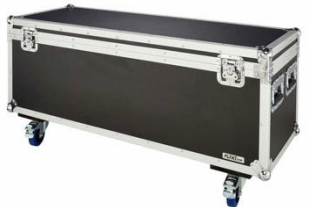
C2002 Accessory Case