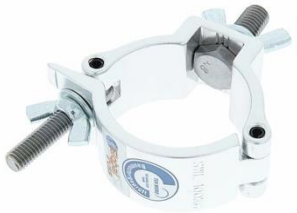
R2001 Halfcoupler Silber