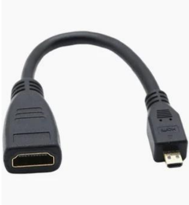
V0151 Mikro HDMI (m) to HDMI (w)