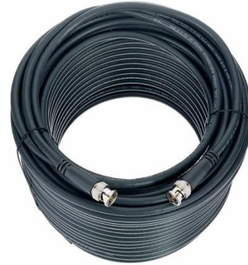
V4025 SDI 30m