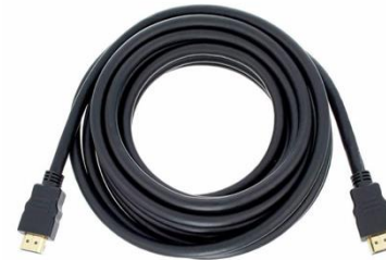
V4101 HDMI 5m