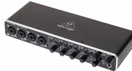
A0004 Behringer Uphoria 404hd

Input DSP: 8Ch Multitrack Rec.: Nein USB Rec.: Ja Stückzahl: 1