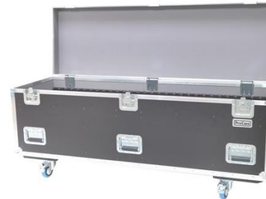
C2012 Multiflex 180