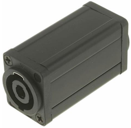
A0311 Speakon Adapter 4-pol