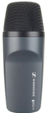
A1122 Sennheiser e602 II

Aufnahmeart: Dynamisch Charakteristik: Superniere Stückzahl: 3