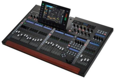
A0001 Behringer Wing Black

Input DSP: 48Ch (bis 96Ch) StageBox Con.: AES50 Multitrack Rec.: Ja Stückzahl: 1