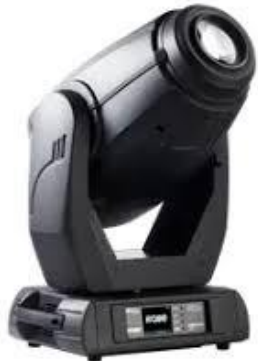
L1006 Robe MMX Spot

Lichterzeugung: Entladungslampe Stückzahl: 8