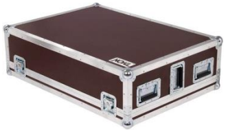
C0001 Behringer Wing Case