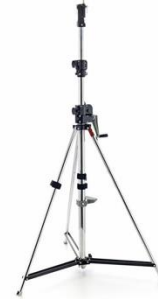
R5005 Euro-lite Wind Up 85kg