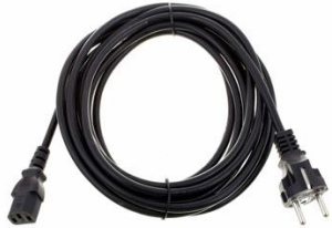
P3001 Kaltgeräte Anschlusskabel