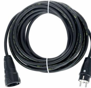
P1006 SchuKo 10m