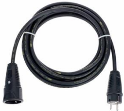
P1005 SchuKo 5m