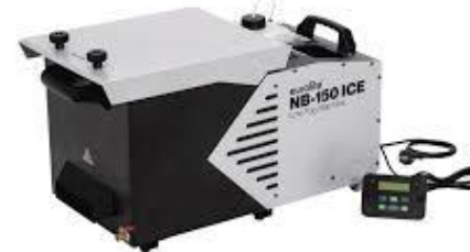
L1101 Eurolite NB-150 ICE Boden Nebel

Lichterzeugung: Entladungslampe Stückzahl: 8