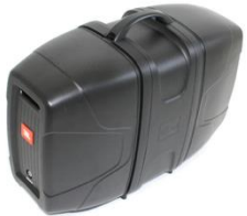
A2001 JBL Eon 206P

Lautsprecher Art: Passiv inkl. Powermixer Range: Fullrange Stückzahl: 1