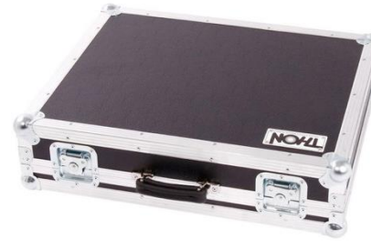
C0005 Thon Case Command Wing