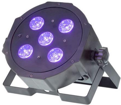
L1002 FunGeneration SePar Quad RGBUV