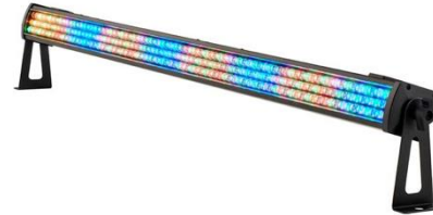
L1003 Stairville LED Bar 240/8

Lichterzeugung: LED Ansteuerbare Segmente: 8 Stückzahl: 4