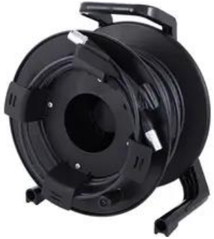
N2001 Ethercon 50m