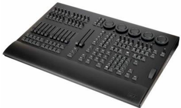
L0004 GrandMA3 Command Wing