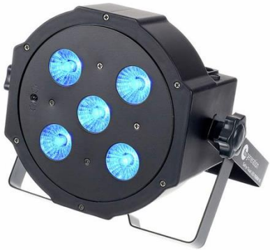
L1001 FunGeneration SePar Quad RGBW