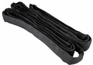
R4611 Rundschlinge 4m 2t