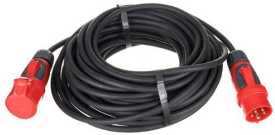
P0004 16A CEE 20m

Adern Querschnitt : 2,5mm 2 Stückzahl: 1