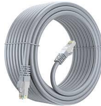
N2320 Cat 5e 20m