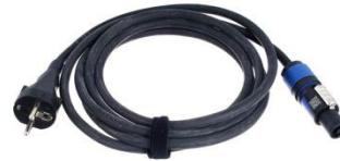
P3101 Powercon Blau Anschlusskabel