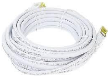
N2310 Cat 5e 10m