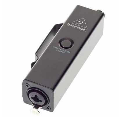
A0405 Behringer Powerplay P2