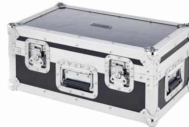
C5001 48 Pin Set