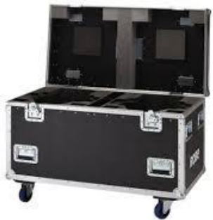
C3002 MMX Case