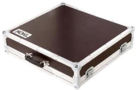
C0004 Analogpult Case