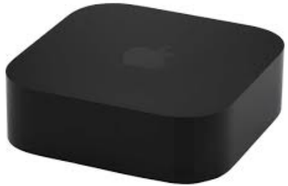
V2201 Apple TV