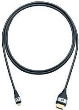
V0155 Mikro HDMI (m) to HDMI (m)