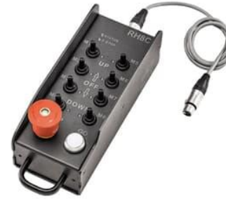
R3102 4 Ch. Motoren Fernsteuerung