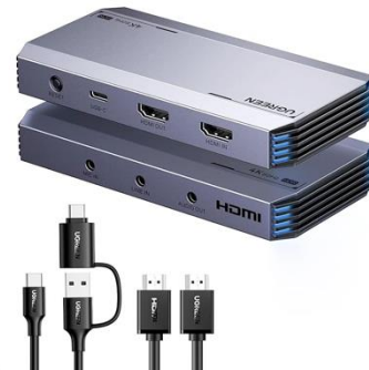
V0051 UGreen Capture Card