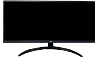
V2003 LG UltraWide 21:9