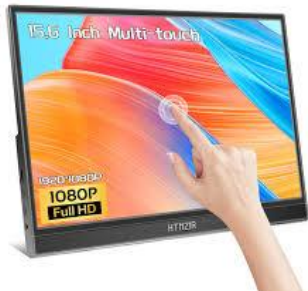
V2002 Touchmonitor 15" Portable