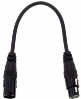
L0110 DMX Adapter 5 Pol – 3 Pol