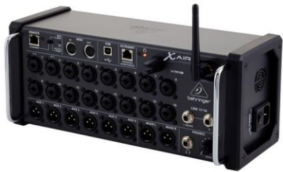
A0002 Behringer Xair XR 18

Input DSP: 48Ch (bis 96Ch) StageBox Con.: AES50 Multitrack Rec.: Ja Stückzahl: 1