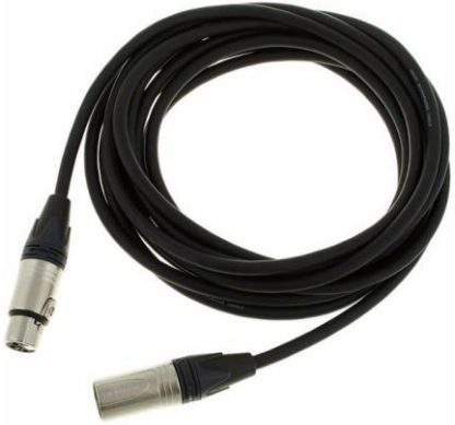
A0105 XLR 5m