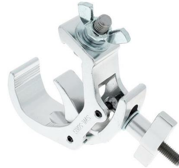
R2003 Quicklock Silber/Schwarz