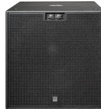
A2501 HK-Audio CSub 118

Lautsprecher Art: Dynamisch Range: Fullrange Stückzahl: 2