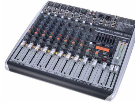
A0003 Behringer Xenyx QX1222 USB

Input DSP: 18Ch Multitrack Rec.: Ja Remote Ctrl.: via Netzwerk Stückzahl: 1