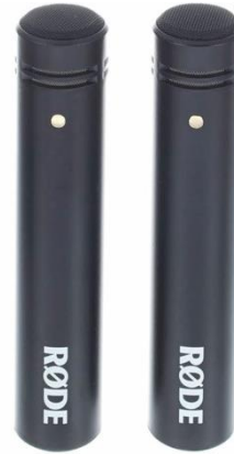
A1151 Rode M5 MP

Aufnahmeart: Dynamisch Charakteristik: Niere Stückzahl: 1