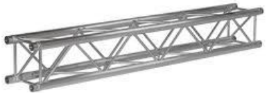
R0002 Truss 2m Prolyte