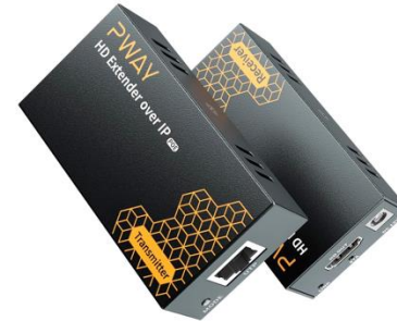
V0112 HDMI Ethernet Extender IP 120m

Übertragungslänge: 60m over IP: Nein Stückzahl: 1