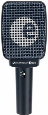
A1111 Sennheiser e906

Aufnahmeart: Dynamisch Charakteristik: Superniere Stückzahl: 4