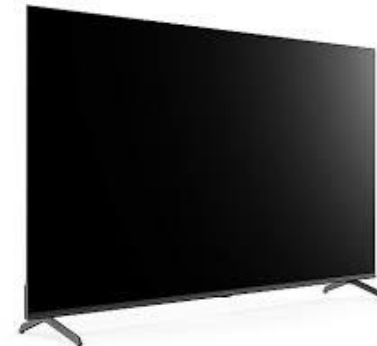
V2101 Peak 65" Fernseher 4k