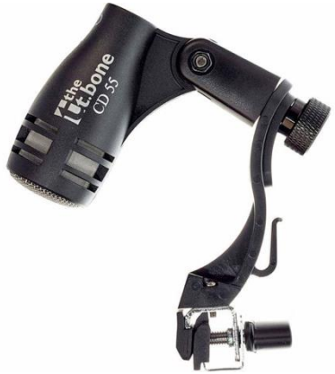
A1121 t.bone Tom Mics CD 55

Aufnahmeart: Dynamisch Charakteristik: Superniere Stückzahl: 3