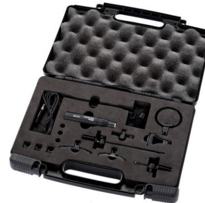
A1171 Ovid RC 100 Set

Frequenz: 660 MHz Stückzahl: 1 Doppelset