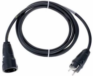
P1003 SchuKo 3m