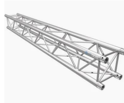
R0003 Truss 2,5m Prolyte