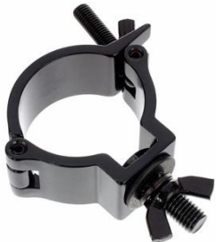
R2002 Halfcoupler Schwarz