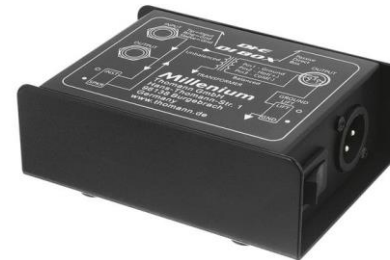
A0501 Mono DI