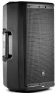
A2101 JBL Eon 612

Lautsprecher Art: Passiv inkl. Powermixer Range: Fullrange Stückzahl: 1