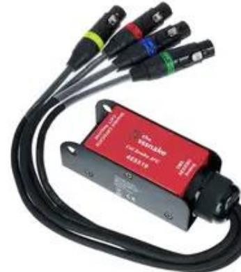
N3002 4x DMX to Cat