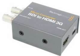
V0101 Blackmagic SDI to HDMI