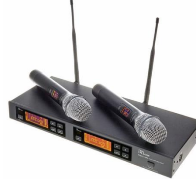
A1001 t.bone Twin Keulen

Frequenz: 660 MHz Stückzahl: 1 Doppelset