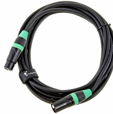
L0105 DMX 3-Pol 5m