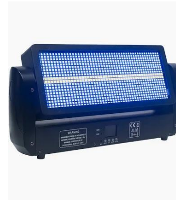
L1005 Flash LED Moving Strobe

Lichterzeugung: LED Ansteuerbare Segmente: 8 Stückzahl: 4