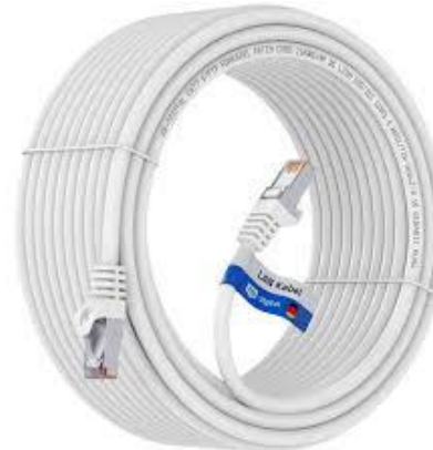
N2330 Cat 5e 30m