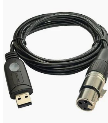
L0003 DMX – USB Adapter