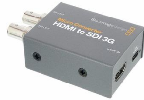
V0102 Blackmagic HDMI to SDI

Anschlussart: SDI Inputs: 8 Stückzahl: 1