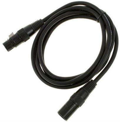
L0103 DMX 3-Pol 2m