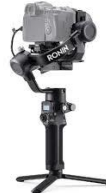
V1501 DJI Ronin Kamera Gimbal