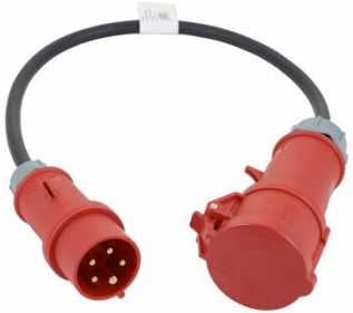
P0061 16A to 32A Adapter