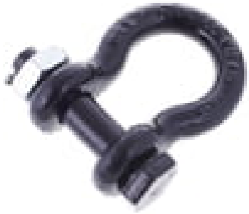
R4603 Schäckel 3,25t