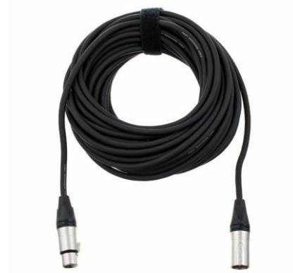
A0107 XLR 15m