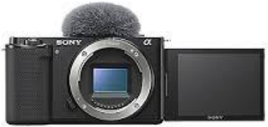
V1001 Sony ZV-E10

Sensor: APSC Output: USB-C, Mikro HDMI Stückzahl: 1