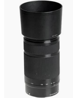
V1102 Sony E-Mount 55-210mm

Sensor: APSC Output: USB-C, Mikro HDMI Stückzahl: 1