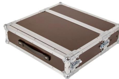
C3951 6HE Motorsteuerung Rack