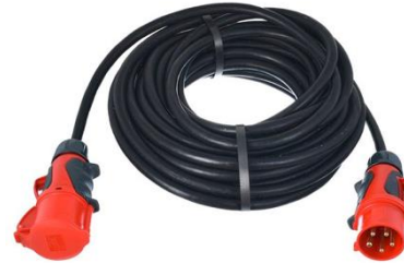
P0014 32A CEE 20m

Adern Querschnitt : 2,5mm 2 Stückzahl: 1