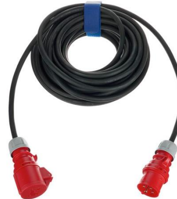
P0401 Chainhoistkabel 20m