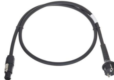
P3201 True1 Anschlusskabel