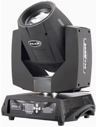
L1004 Etec Beam 230W 7R

Lichterzeugung: Entladungslampe Stückzahl: 4