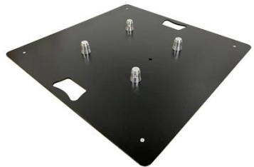
R1502 Baseplate 20kg Quadratisch

Material: Gewalzter Stahl, unbeschichtet Halbkonus: Global Truss, Prolyte Stückzahl: 2