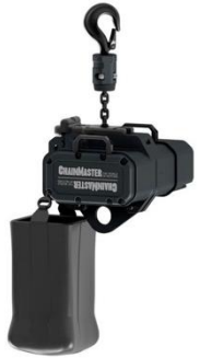
R3001 Chainmaster D8+ Kettenzug