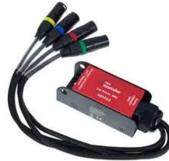
N3001 Cat to 4 DMX

Leitungen: 2x Ethercon, 2x DMX, 2x Schuko Stückzahl: 1