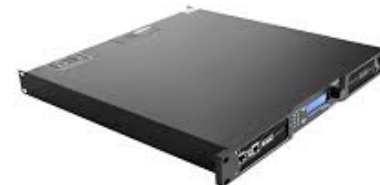
A2801 Sinbosen D4-1500 DSP

DSP: Ja Leistung: 1500W an 8Ω Stückzahl: 1