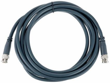
V4013 SDI 3m