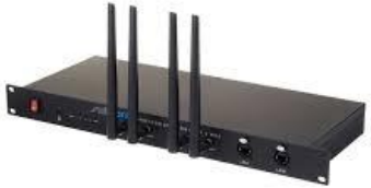
N0001 SwissSonic MKII Stagerouter