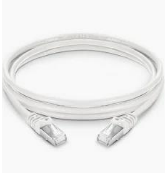
N2201 Cat Patch Kabel