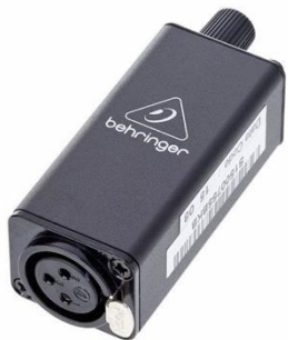
A0402 Behringer Powerplay PM1