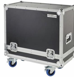
C4001 12“ Boxencase