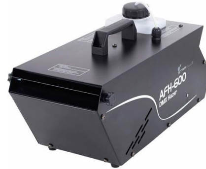
L1102 Stairville AFH-600 Hazer

Lichterzeugung: Entladungslampe Stückzahl: 4