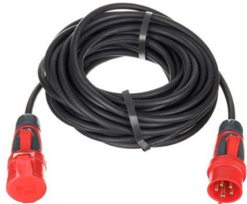
P0005 16A CEE 25m