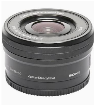
V1101 Sony E-Mount 16-50m