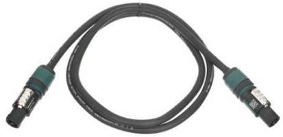
A0301 Speakon NL4 3m