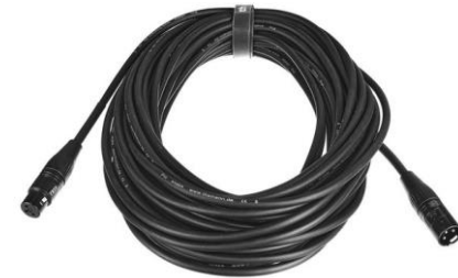
A0108 XLR 20m