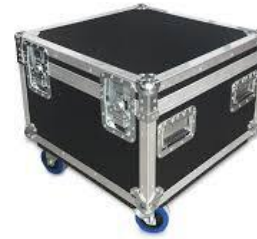
C3901 Amptown Motorcase