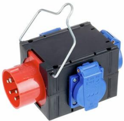
P0081 16A CEE Auflösung