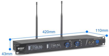
A0403 Debra Doppel-Transmitter

Bluetooth: Ja Frequenzband: 500 MHz Stückzahl: 2