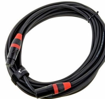
L0106 DMX 3-Pol 10m