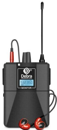
A0404 Debra Receiver

Bluetooth: Ja Frequenzband: 500 MHz Stückzahl: 2