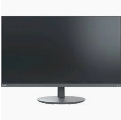
V2001 Bildschirm 24"