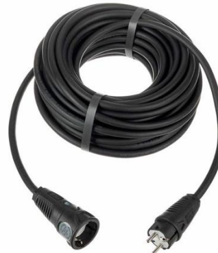
P1008 SchuKo 20m