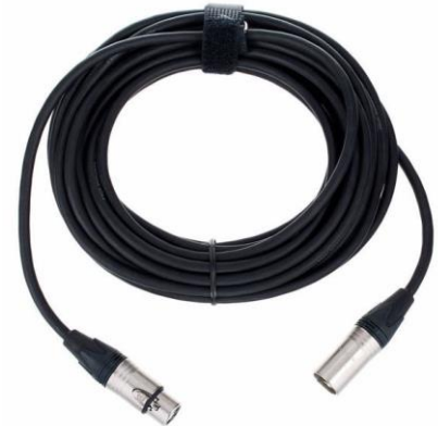
A0106 XLR 10m