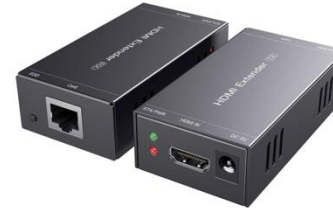
V0111 HDMI Ethernet Extender 60m

Übertragungslänge: 60m over IP: Nein Stückzahl: 1