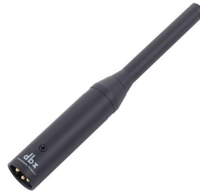
A1162 dbx Messmikrofon

Aufnahmeart: Dynamisch Charakteristik: Niere Stückzahl: 2