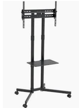
R5301 Fernseher Stativ