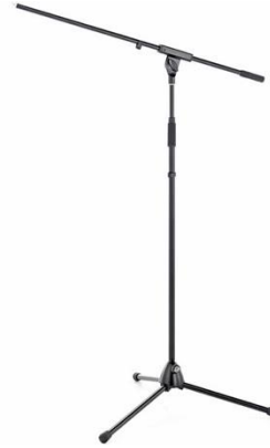
R5007 Distanzstange M20

Höhe: 820 – 1400mm Tragkraft: 30kg Stückzahl: 2