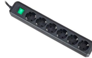
P1503 SchuKo 6er Verteiler