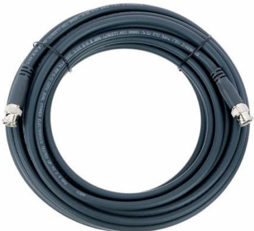
V4020 SDI 15m